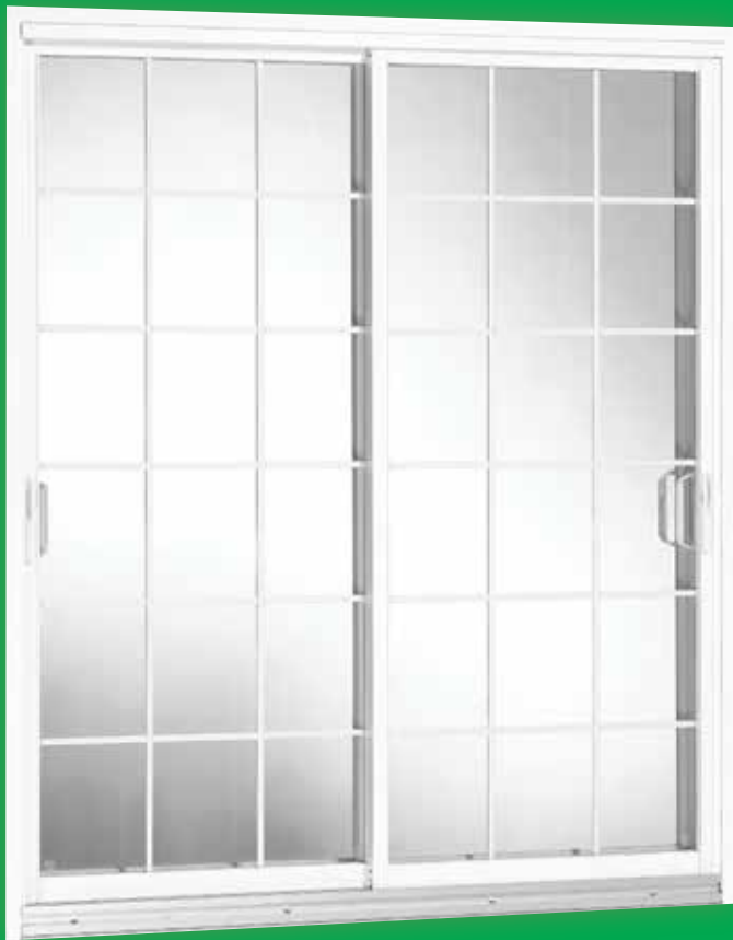
Porte blanche avec carrelage standard rectangulaire blanc

NUL AUTRE ne fabrique des portes patio d'avant-garde comme Portes Standard Inc. le fait depuis plus de 50 ans.