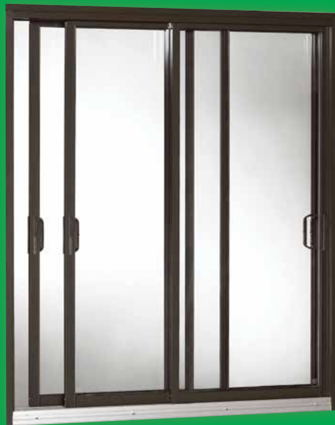
Porte couleur brun commercial